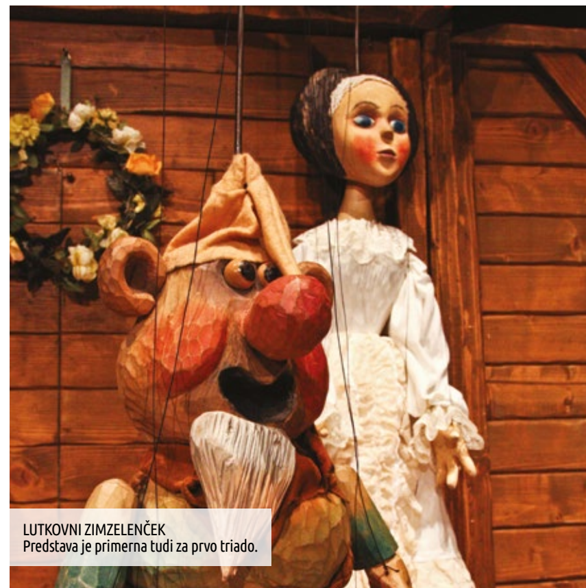
LUTKOVNI ZIMZELENČEK Predstava je primerna tudi za prvo triado.