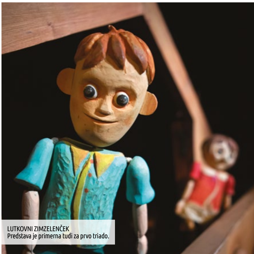
LUTKOVNI ZIMZELENČEK Predstava je primerna tudi za prvo triado.