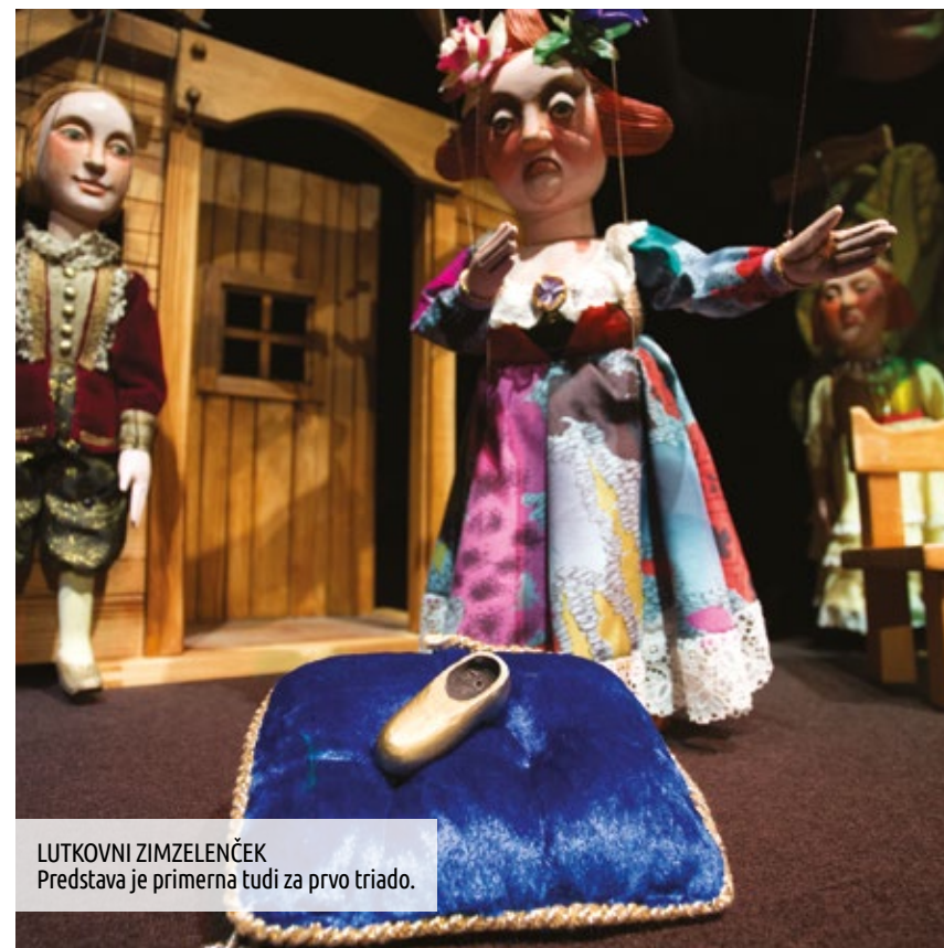
LUTKOVNI ZIMZELENČEK Predstava je primerna tudi za prvo triado.

Helge pravzaprav ne ve, kdaj ježevci dozori ... Toda ko pade s češnje, se nenadoma znajde v kolesju nenavadnih in prismuknjenih prizorov. Skupaj z njim raziskujemo svet prikupnih živali, ki je včasih brez logike in smiselna na povsem svojevrsten način. Slikanica, po kateri je predstava nastala, je bila nagrajena z večernico za najboljšo slovensko otroško ali mladinsko izvirno leposlovno delo, na odru pa je zaživela kot lutkovna igrlica, v kateri se z besedami, pomeni, igračami in smisli, lutkami in nesmisli igramo vsi v dvorani.