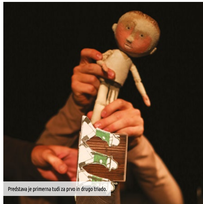
Predstava je primerna tudi za prvo in drugo triado.

Klasična lutkovna predstava, ki s prepletom dveh zgodb osvetljuje človeške lastnosti, kot so naivnost, iskrenost in poštenje.