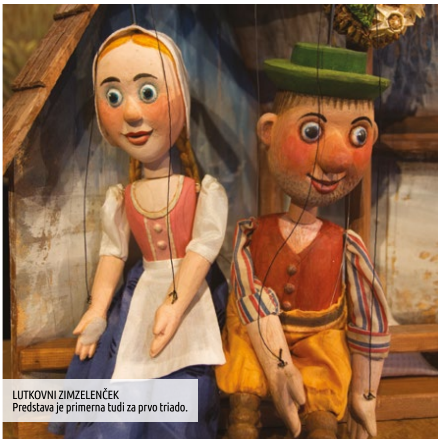
LUTKOVNI ZIMZELENČEK Predstava je primerna tudi za prvo triado.