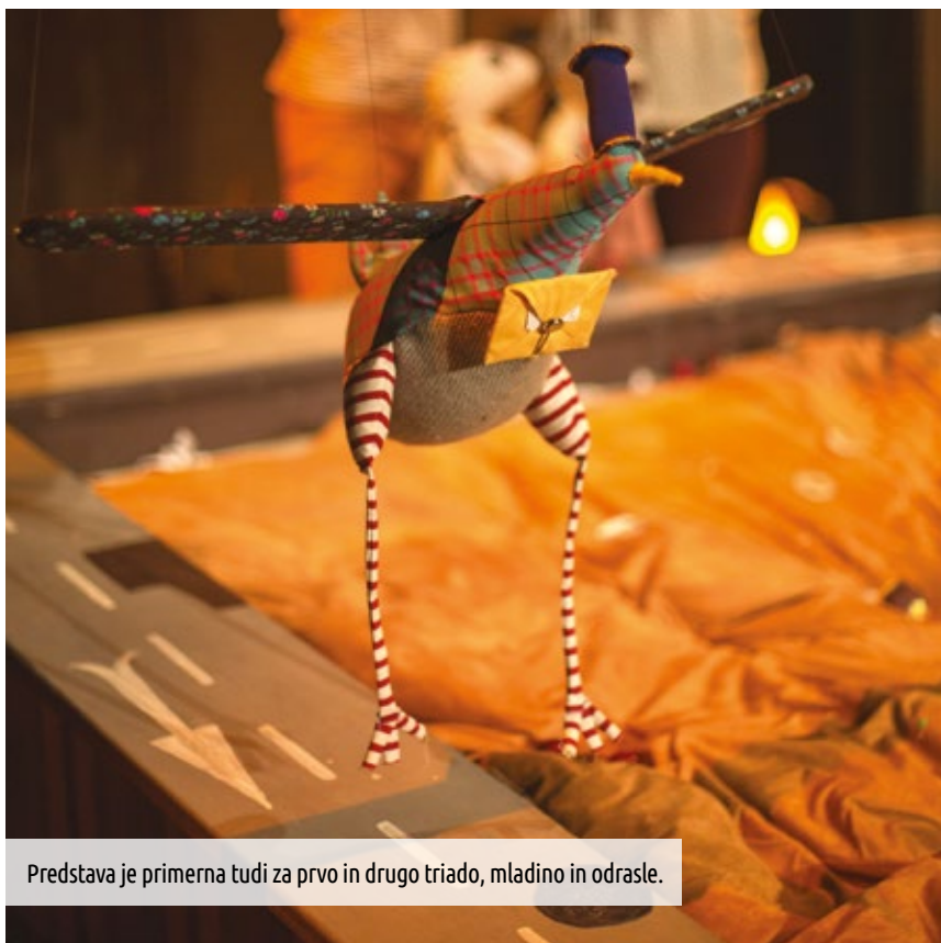
Predstava je primerna tudi za prvo in drugo triado, mladino in odrasle.